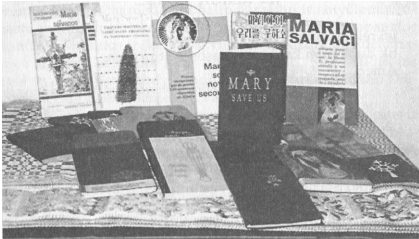
Sibiro maldaknygės vertimų kolekcija