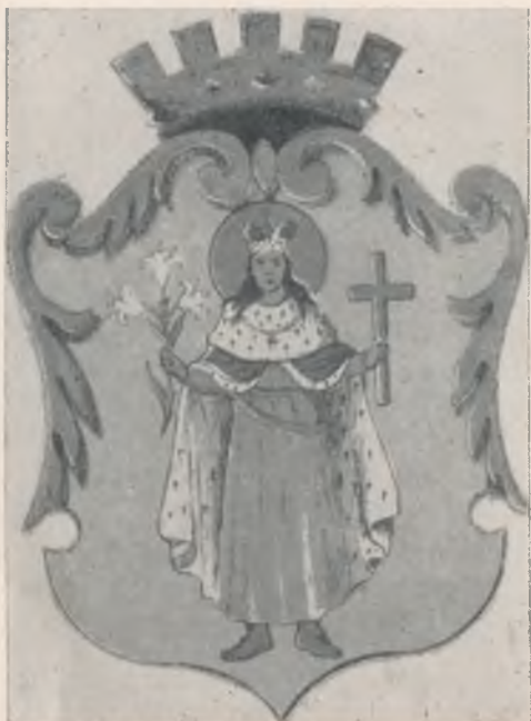
šv. Kazimieras Darsūniškio m'esto ženkle.