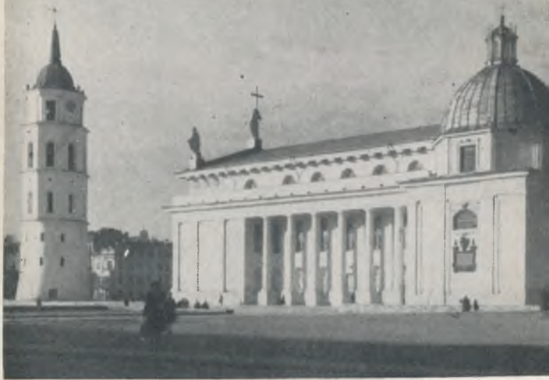
Vilniaus katedra. Dešinėje šv. Kazim'ero kopnyčia.

nuosaikumas įsiviešpatautų žmonių papročiuose. Jei gretinti jį su kitais jo broliais, tai jis buvo energingesnis, valingesnis, gabesnis ir pamaldesnis už visus keturis jaunesnius brolius.