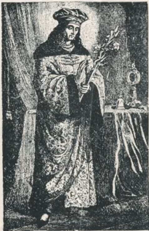
Šv. Kazimiero paveikslas, seniausiai var- tojamas lietuviškuose šventųjų gyvenimų aprašymuose.