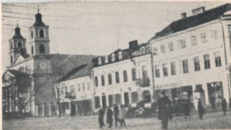
šv. Kazimiero bažnyčia Suvalkuose.

Vilnių, šventojo kūnas 8 metus buvo paslėptas Roženkoje. Reikėjo jį slėpti ir 1703 m. švedų invazijos metu. Nepaliko jo kūno ramybėje ir bolševikai, nes jiems, Vilniaus katedrą pavertus muziejumi, šventojo Kazimiero kūną 1953 m. reikėjo perkelti į šv. Petro ir Povilo bažnyčią Antakalnyje. Kaip Rusijos carų metu buvo draudžiama švęsti šv. Kazimiero šventę, taip ir šiais metais tos pačios Rusijos bolševikai neleis iškilmingai paminėti ir 500 metų šventojo gimimo