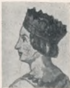
Kazimieras Jogailaitis (kairėje) ir Elzbieta (dešinėje) — šv. Kazimiero tėvai.

saugojamas nuo pataikūnų, mokomas maldingumo, tvarkingumo, kuklumo, teisingumo, iškalbos ir fizinės mankštos. Svarbiausias Kazimiero auklėtojas buvo Krokuvos kan. Jonas Dlugošas. Iš jo karalaitis daug išmoko apie įvairias šalis, krikščionių tikėjimą, popiežių, Romą ir šv. Žemę. Jis supažindino berniuką su Lietuvos ir Lenkijos praeitimi, papasakojo jam apie Žalgirio mūši, išmo-