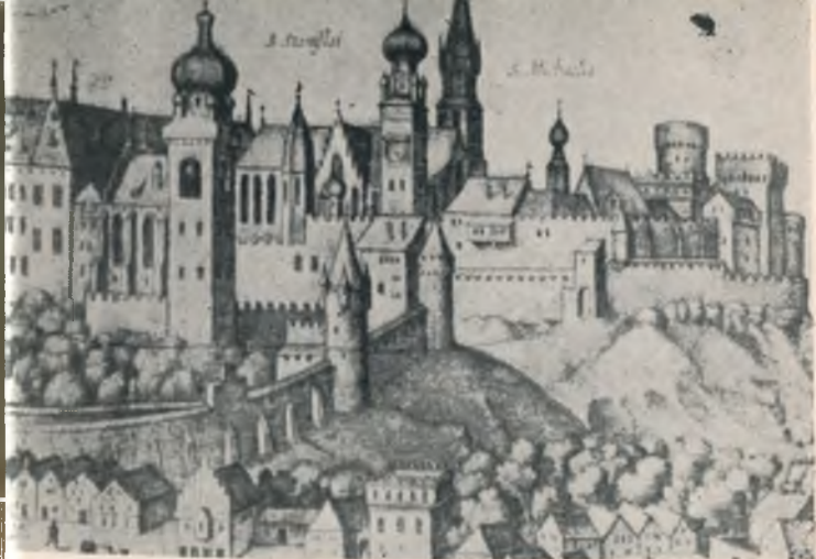
Vavelio pilies vaizdas Krokuvoje 16 a. šioje pilyje 1458 spalio 3 gimė šv. Kazimieras.

kuvos rūmuose. Rūmų puošnumas, drabužių švelnumas, žaislų perteklius ir auklių pataikavimas dažnai dar mažuose karalių kūdikiuose pasėja puikybės ir kitų ydų daigus. Laimi mūsų karaliai šio aplinkuma nepažeidė, nes nuo blogos įtakos ji budriai saugojo tikinčiųjų tėvų akys.