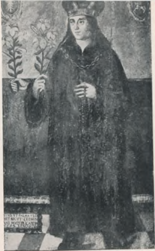
Vilniškis trijų rankų šv. Kazimiero paveikslas, pieštas apie 1536 m. pagal dingusį originalą.