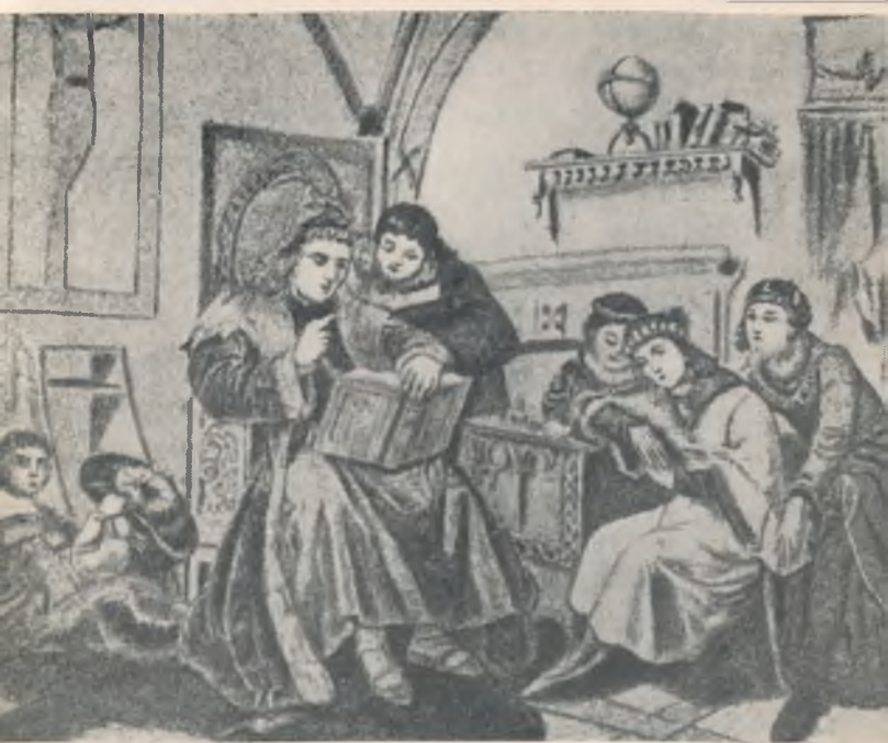
J. Dlugošas moko karalaičius, per jo petį žiūri šv. Kazimieras.

šventoji ugnis ir kai šniokšdami krito pakirsti šventieji ažuolai. Džiaugėsi jis, kai iš savo mokytojo sužinojo, jog jo senelis šventaragio slėnyje pastatė Vilniaus katedrą, joje įsodino pir-