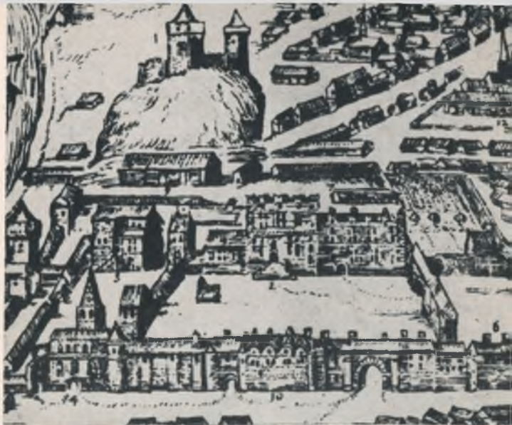
Senasis Vilnius pagal Brauno atlasą 1581 m.

bičiuliavimosi su Čekijos husitais. Jis sielcojosi vis didėjančiu turkų pavojumi. Jo rūpesčiu buvo parašytas ir kovoje su turkais žuvusio dėdės Vladislovo gyvenimas.