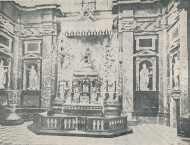
Šv. Kazimiero koplyčios vidus su jo karstu Vilniaus katedroje.