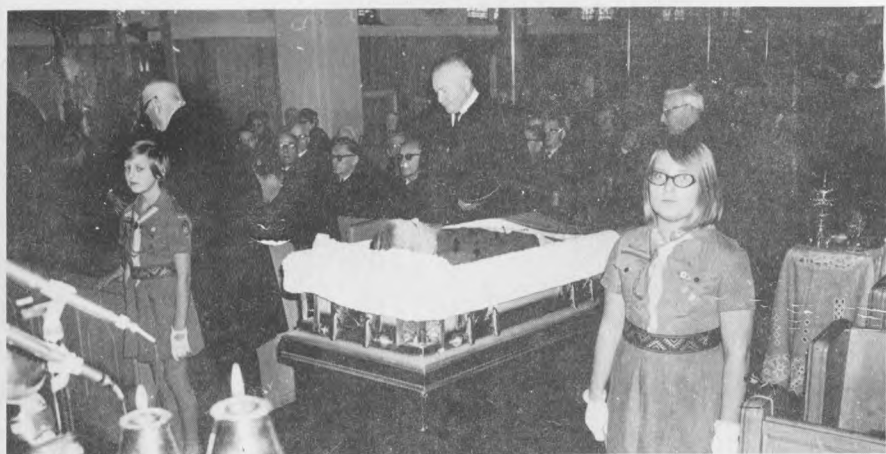
Skautų ir Kęstutiečių garbės sargyba prie karsto.