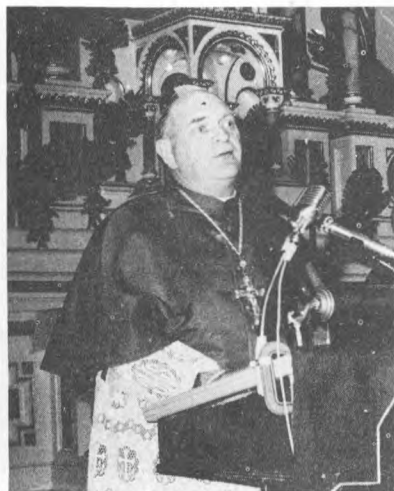
Vyskupas Alfredas Abramowicz taria užuojautos žodį Lietuvių tautai Chicagos arkivyskupijos vardu.